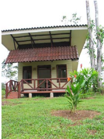
Uno de los bungalows del nuevo Maquenque Ecolodge, ecológicamente pensados para minimizar el consumo de energía.